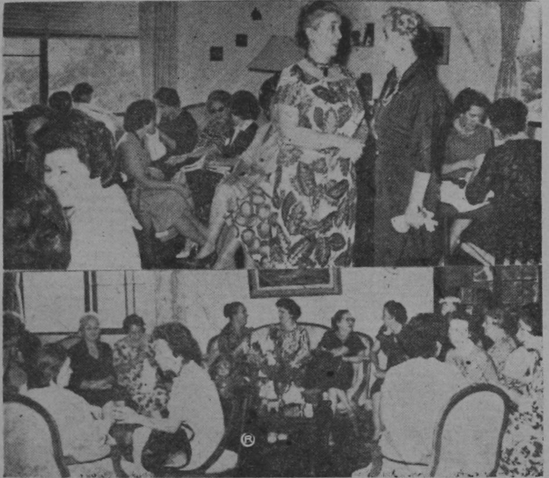
Ayer en la Embajada de Francia se dio inicio a los té de costura que todos los lunes celebran las damas del Cuerpo Diplomático y Colonias Extranjeras a beneficio del Ropero del Corazón de María Inmaculada.

La gráfica presenta un aspecto de este distinguido suceso social.